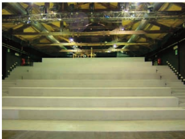
Sala A: tribuna