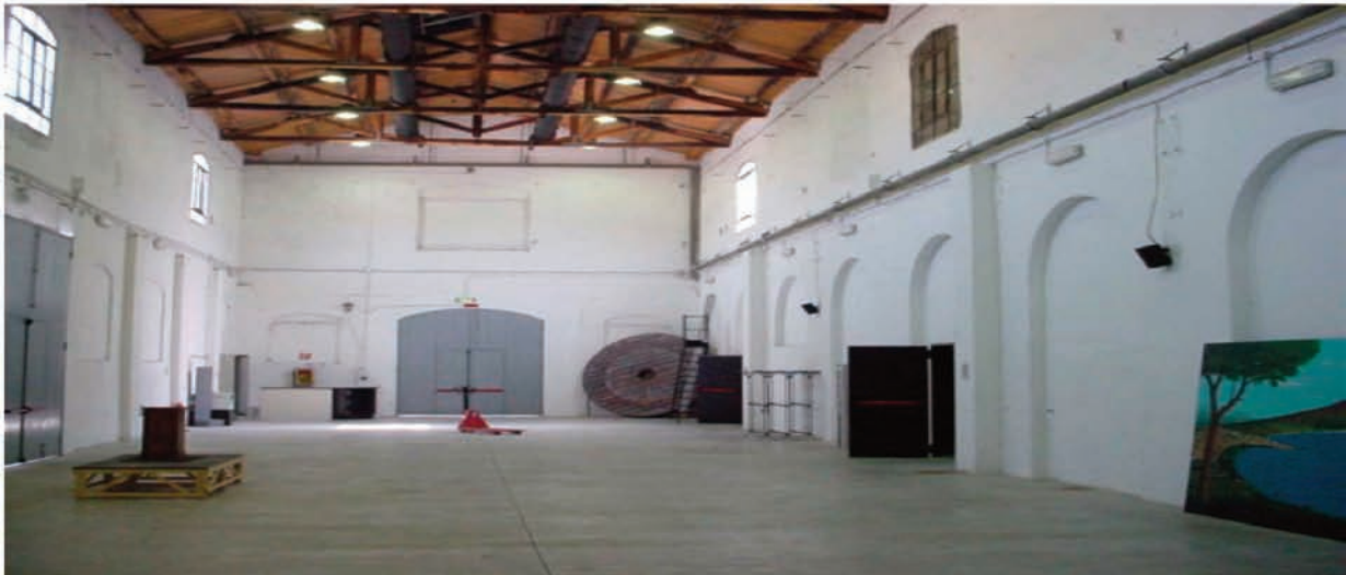
Teatro India: Foyer