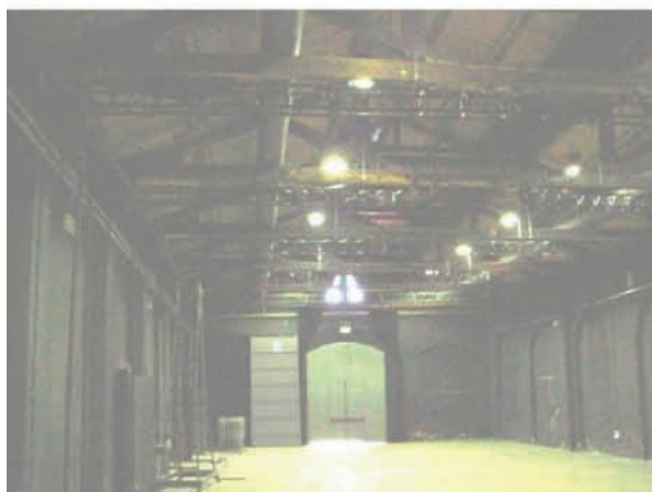
Sala B: americane