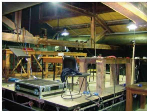
Sala A: controllo luci e suono