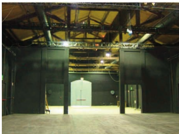
Sala A: palcoscenico