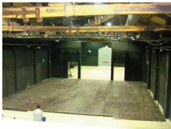
Sala A: palcoscenico