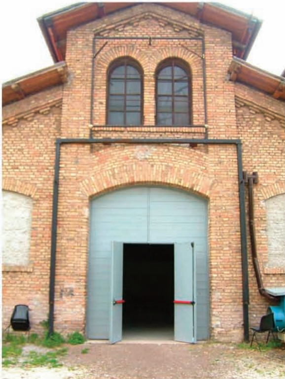
Sala A: ingresso materiali

Camerini: 2 singoli 2 per 8 persone Sartoria: lavatrice – asciugatrice Scarico: Porte di accesso: larghezza: 2.84 m altezza: 3.30 m