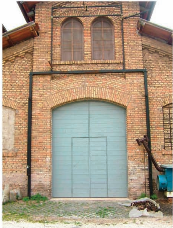
Sala B: ingresso materiali